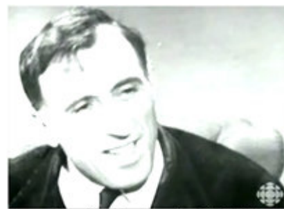
Jean Vanier, cuando inició El Arca

Navegando por Internet llegamos a los archivos digitales de la CBC de Canadá, y encontramos la entrevista más antigua de la que se tenga registro, realizada a Jean Vanier en 1965 tras haber abierto el primer hogar del arca. Pueden verla haciendo click aquí, o desde el sitio