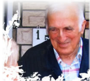
Jean Vanier, à l'Arche d'Argentine

“Un des grands maux de notre société est le rejet de la fragilité ... Tous, nous avons soif d'amour, mais peur d'aimer. Nous construisons des murs entre les uns et les autres. Cependant, quand se dissipe la peur et que nous nous ouvrons à la tendresse, nous découvrons, émus, où est la Source de Vie... Les personnes ayant des déficiences intellectuelles, nous enseignent ce chemin ...”