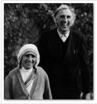
Phrase du jour

“Le grand pour moi, c’est aimer la réalité et non pas vivre dans l’imagination, non pas vivre dans ce qui aurait pu se passer, ce qui devrait avoir lieu ou ce qui est possible, c’est aimer la réalité et à partir de là découvrir que Dieu est présent en elle”. (Jean Vanier, entrevue avec Public Radio, Déc. 2007)