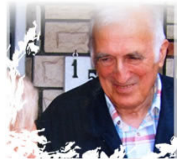
Jean Vanier, en el arca de Argentina

"Uno de los grandes males de nuestra sociedad es su rechazo a la debilidad... Todos tenemos sed de amor, pero miedo de amar. Construimos muros entre unos y otros. Sin embargo, cuando se disipa el temor y nos abrimos a la ternura, descubrimos emocionados dónde está la fuente de vida...Las personas con discapacidades mentales, no enseñan ese camino..."